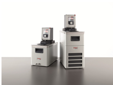
DYNEO Kälte- und Wärmethermostate

JULABO GmbH Silja Moser-Salomon +49 (0) 07823-51 156 s.moser@julabo.com www.julabo.com